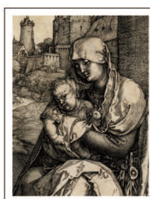
Dürer Albrecht Madonna presso il muro 1514

A dicembre andrà in asta una eccezionale collezione di mappe e vedute di Firenze, dalle prime xilografie quattrocentesche ai panorami fotografici di inizi novecento, che include una magnifica copia rilegata delle Piazze di Firenze e delle Vedute della Toscana di Giuseppe Zocchi; accanto alla cospicua scelta di immagini della città gigliata, fulcro di un catalogo di circa 300 lotti interamente riservato alla cartografia, anche importanti carte dell'Italia: fra tutte la mappa murale dell'Italia del Cassini e l'Italia del Sylvanus. Si annoverano poi una sezione di mappe e vedute di Siena e il set di Planisfero e Continenti del Blaeu.