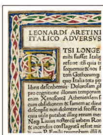
Bruni Leonardo De bello italico... 1470