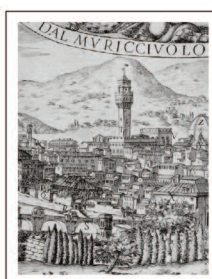
Spada Valerio Veduta di Firenze, 1650 ca.

Presso il nostro stand saranno disponibili i cataloghi delle Aste. In concomitanza con il Congresso ILAB, Gonnelli Casa d'Aste rende possibile la visione in anteprima dei lotti nei locali della Libreria Antiquaria Gonnelli a Firenze.